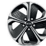
16-Zoll-Leichtmetallfelgen und Bereifung 205/60 R16 (Serie für Vision/Spirit)