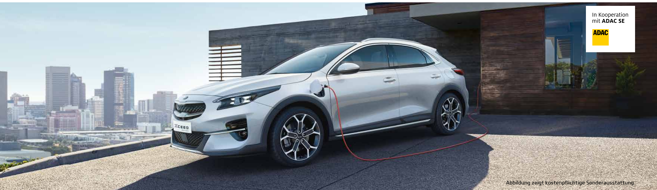
Abbildung zeigt kostenpflichtige Sonderausstattung.

Als ADAC Mitglied können Sie zum Beispiel Ihren Kia Xceed Plug-in Hybrid Vision jetzt besonders günstig leasen: mit 36 Monaten Laufzeit, 4.600 € Sonderzahlung und inklusive Wartung*. Legen Sie bei Ihrem Kia Händler einfach Ihren ADAC Mitgliedsausweis vor, schon kommen Sie in den Genuss der exklusiven Konditionen.