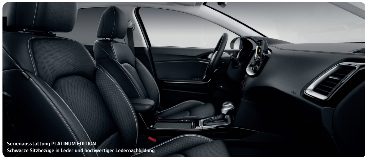
Serienausstattung PLATINUM EDITION Schwarze Sitzbezüge in Leder und hochwertiger Ledernachbildung