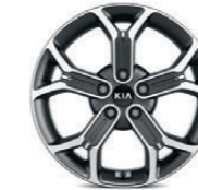
18-Zoll-Leichtmetallfelgen und Bereifung 235/45 R18 (Serie für Platinum Edition, optional für Spirit)

Bei einigen unserer modernen Metallicfarben werden bewusst unterschiedliche Farbpigmente verwendet. Dadurch können unter bestimmten Lichtverhältnissen, z.B. direktes Sonnenlicht, attraktive Farbeffekte erzielt werden. Zum Teil kann die Farbe changieren, z.B. von schwarz zu dunkelblau. Bei den hier abgebildeten Farbdarstellungen kann es aufgrund der Drucktechnik zu Abweichungen zu den Originalfarben kommen. Weitere Informationen zu den Farbeffekten und Grundfarben gibt Ihnen gerne Ihr Kia-Vertragshändler. Metalliclackierungen sind aufpreispflichtig.