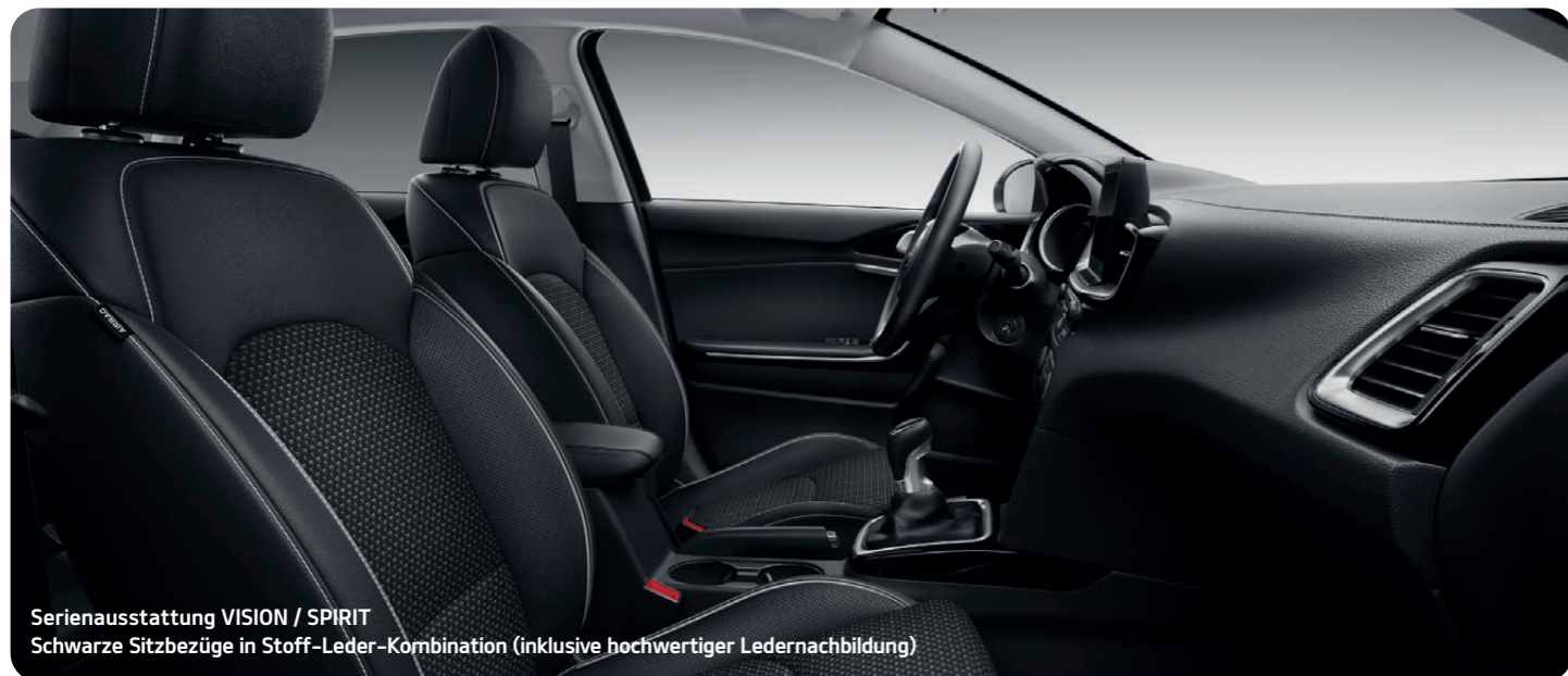
Serienausstattung VISION / SPIRIT Schwarze Sitzbezüge in Stoff-Leder-Kombination (inklusive hochwertiger Ledernachbildung)

Das Interieur des Kia XCeed Plug-in Hybrid besticht durch seine stilvolle Gestaltung und die hochwertigen, sorgfältig ausgewählten Materialien.